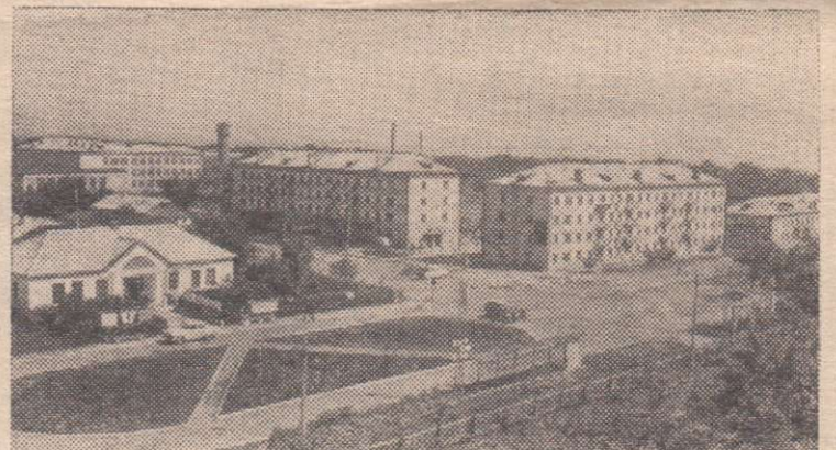
Челябинская область. Благоустроивается совхоз «Лазурный» Красноармейского района. На центральной усадьбе построены жилые дома городского типа со всеми удобствами, школа, магазины, детсад, больница, Дом культуры.

В сборник вошли основные документы и материалы, отражающие опыт работы комсомола по воспитанию подростков, организации их учебы, труда, быта, культурного отдыха. Книга может оказать комсомольским организациям неоценимую помощь в использовании наиболее действенных средств воспитания подрастающего поколения.