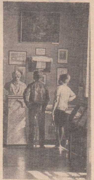
Тюменская область. Тобольский государственный историко-архитектурный музей-заповедник — один из старейших в Сибири. Недавно ему исполнилось 100 лет.

На снимке: у экспозиции музея, посвященной автору бессмертной сказки «Конек-Горбун» поэту П.П. Ершову. В Тобольске он провел большую часть своей жизни — 38 лет.